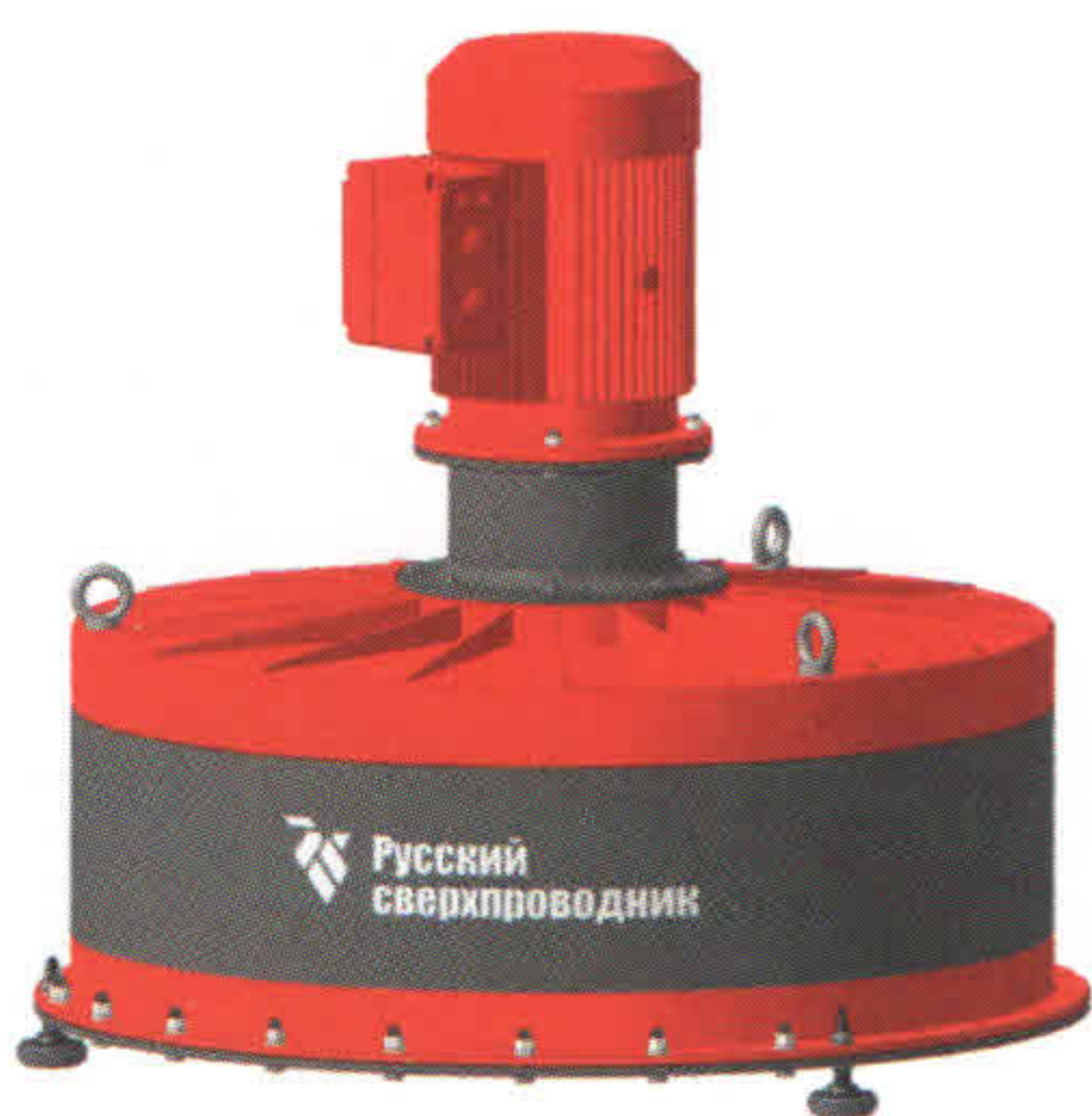
▲ ДИБП компании «Русский сверхпроводник»

Рыночные ниши для динамических ИБП аналогичны тем, что характерны и для ИБП с химическими аккумуляторами.