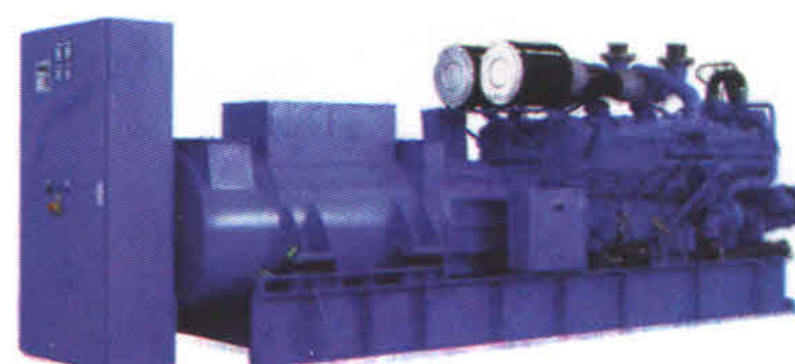
▲ ДИБП компании Piller с размещением в шкафу в комплекте с ДГУ